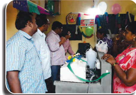
ऑटो ईएमटी के साथ एएमसीयू, विजयवाड़ा में