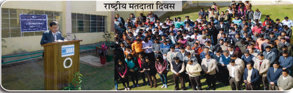
राष्ट्रीय मतदाता दिवस