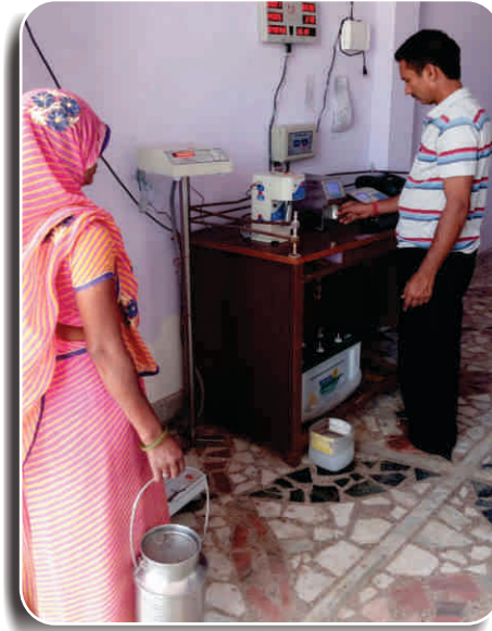
एसपीवी आधारित डीपीएमसीयू, राजस्थान में स्थापित

तिमाही के अंत में, अभी तक के अधिकतम 396 इलेक्ट्रॉनिक मिल्क एडल्ट्रेशन टेस्टर (EMAT) स्थापित किये गये हैं, जिससे इस वर्ष की इनकी कुल संख्या 552 हो गई है, जिससे खाद्य सुरक्षा अभियान ग्राहकों तक पहुंच पाया है और शुद्ध दूध प्राप्त करने के उनके आत्मविश्वास को बढ़ा रहा है।