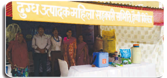
कम्पनी द्वारा ए.एम.सी.यू मॉडल का प्रदर्शन

पशुधन विकास गतिविधियों में महिलाओं की भागीदारी में बढ़ती हुई प्रवृत्ति है, जिससे ग्रामीण समुदायों में महिलाओं के नेतृत्व वाले परिवार सशक्तिकरण की ओर अग्रसर है।