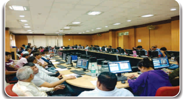
सीसीटीवी निगरानी प्रणाली द्वारा परीक्षा केंद्रों की निगरानी वेबकास्टिंग द्वारा