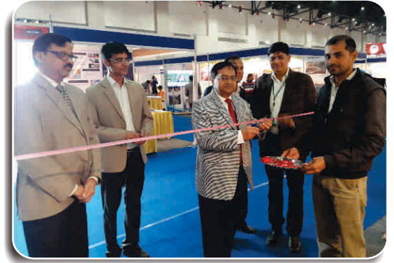
एम.डी., रील कम्पनी की स्टाल का उद्घाटन करते हुए

कंपनी ने अपने नवाचार और मूल्यवान अनुभवों को साझा किया, जिसने भारतीय अर्थव्यवस्था और समाज के विकास की दिशा में योगदान दिया है और प्रौद्योगिकी को ग्रामीण लोगों के बीच पहुंचाना, जिसमें शहर के साथ-साथ भारत सरकार के मिशन जैसे राष्ट्रीय डेयरी योजना, सोलर मिशन, मेक इन इंडिया, डिजिटल इंडिया और स्वच्छ भारत मिशन शामिल है।