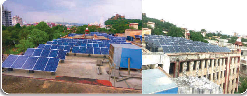
राजस्थान विश्वविद्यालय के विभिन्न भवनों पर सौर ऊर्जा संयंत्र