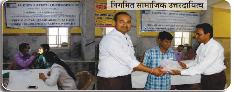
निगमित सामाजिक उत्तरदायित्व