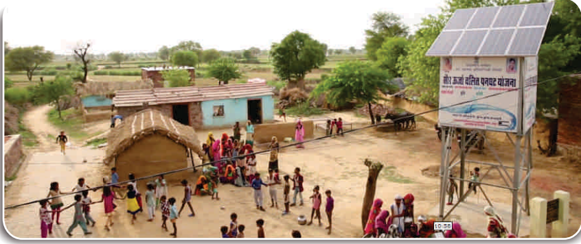
जन स्वास्थ्य अभियांत्रिकी विभाग ( पीएचईडी ), राजस्थान सरकार के लिए सौर ऊर्जा चलित पेयजल प्रणाली